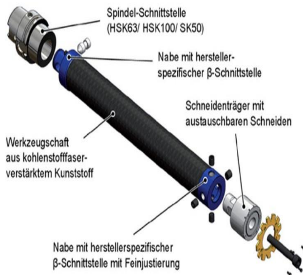
Figura 4. Construção modular de ferramenta de alargador composto.

Outro exemplo mais antigo, mas ainda assim notável, é o rotor composto para fusos de máquinas-ferramenta, apresentado por Lee et al. 9 em 1985. Em comparação com um sistema de rolamento de fuso de aço, observou-se um aumento de 20% na largura máxima de corte, e as características de pré-carregamento foram mais estáveis no sistema composto. 9