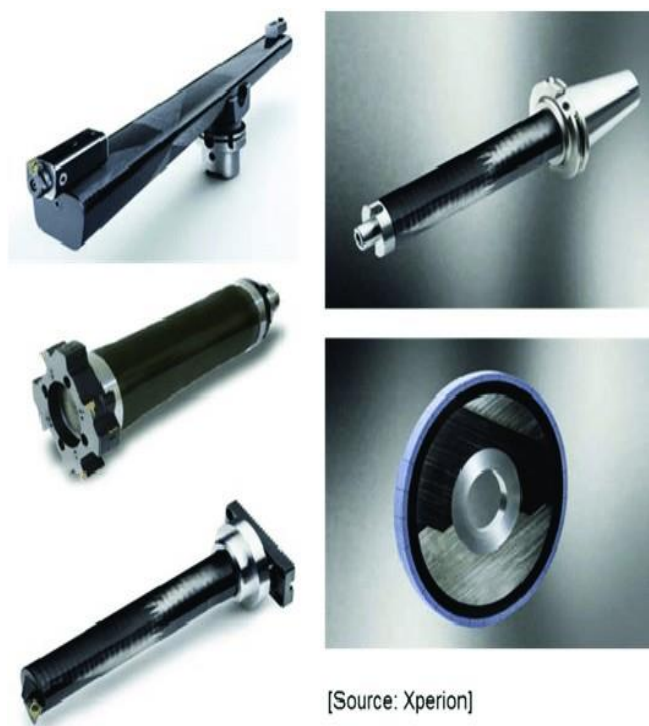
Figura 3. Compósitos em ferramentas de corte e retificação metálica da Xperion. Extraído de https://www.addcomposites.com/ .

Um outro exemplo de sucesso dos materiais compósitos é o eixo de alargador composto com interfaces específicas para os segmentos metálicos da ferramenta que o Heisel et al. 8 desenvolveu que pode ser visto na figura 4. Comparando as massas da ferramenta de aço convencional e da ferramenta recém-projetada, teve uma redução de 28,5 kg para 10,5 kg, além de um aumento na rigidez e uma melhoria significativa na frequência natural fundamental. 8