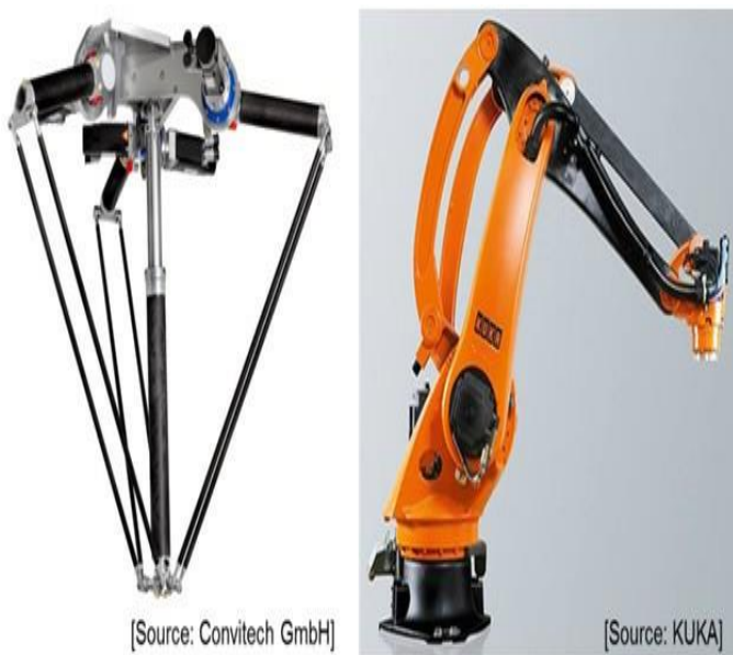
Figura 2. Robôs que pegam e colocam objetos da Convitech e da Kuka.

Por outro lado, dispositivos de metrologia e máquinas de inspeção exigem uma precisão muito alta, além da necessidade de uma rigidez dinâmica máxima e capacidade de amortecimento. As propriedades dinâmicas benéficas dos compósitos foram aproveitadas por Lee et al. 4 no que diz respeito ao projeto de um braço guia de uma máquina de corte de fio por descarga elétrica. Utilizando o método dos elementos finitos, um design detalhado em relação ao comprimento de ligação e ao número de camadas de reforço foi conduzido. O método dos elementos finitos é uma técnica computacional que simula o comportamento de estruturas complexas dividindo-as em elementos discretos, permitindo uma análise precisa de suas propriedades físicas.